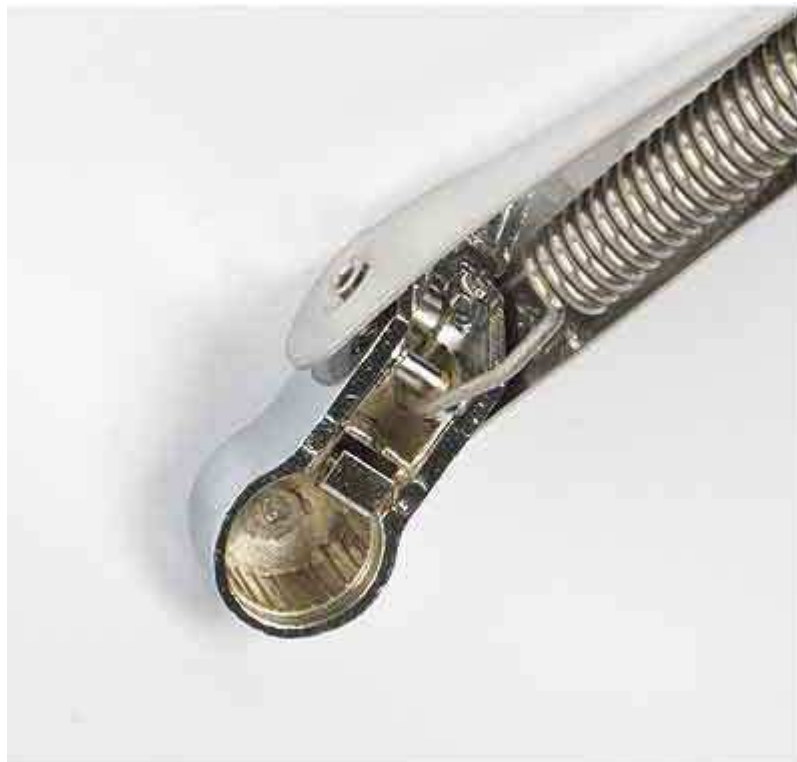
Limora - Montageanschluss

Die sind sogar aus V2A, doch leider passt der Montageanschluss nicht und der Wischerarm ist ca. 10 cm zu kurz.