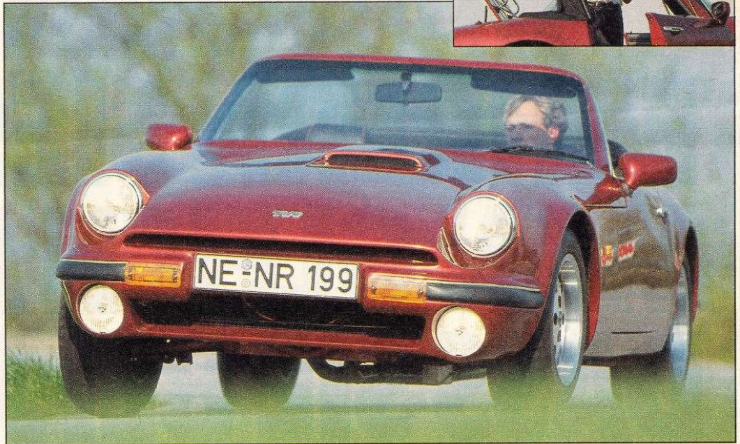
Klassisch: TVR S 3C mit GFK-Kleid im Stil der 60er. Oben: Targa-Variante. Zwei feste Dachplatten zum Herausnehmen

Nach bewährtem Rezept von Firmengründer TreVoR Wilkin-son baut TVR hier auch heute noch moderne Nostalgie auf Rädern. Hochkarätige Renntechnik, eingepackt in den Charme der 60er. Wie den TVR S 3C. Ein Roadster reinsten Wassers – sorry: reinsten schottischen Landweins natürlich. Denn mit Whisky hat der TVR S 3C so manches gemeinsam. Er ist genauso hart, ebenso ehrlich – und er kann bei überschwänglichem Genuß zur Abhängigkeit führen.